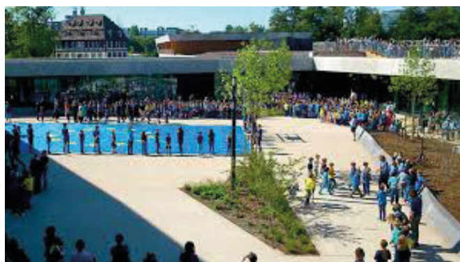
L'École européenne de Strasbourg a été créée en 2008. Elle est devenue un établissement public local d'enseignement en 2015.